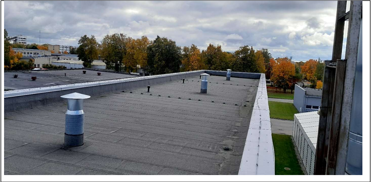
1 pav. Esamos situacijos fotografacijos